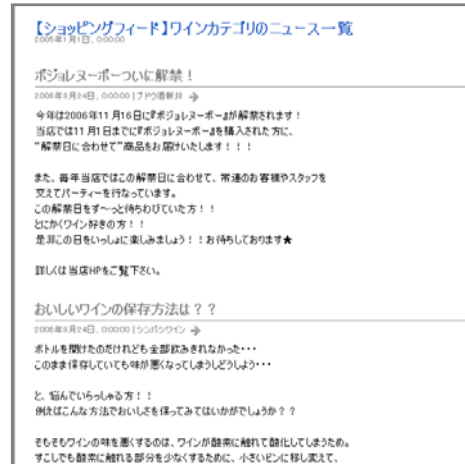
「カテゴリーのニュース一覧」ページ

「ショッピングフィード」のサービス開始時期は 11 月上旬を予定しており、決定次第発表いたします。Eストアーは、今後も独自ネットショップの「集客力」を確実にアップさせる施策を提供し続けます。